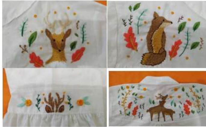
Gambar 5. Hasil sulaman pada busana