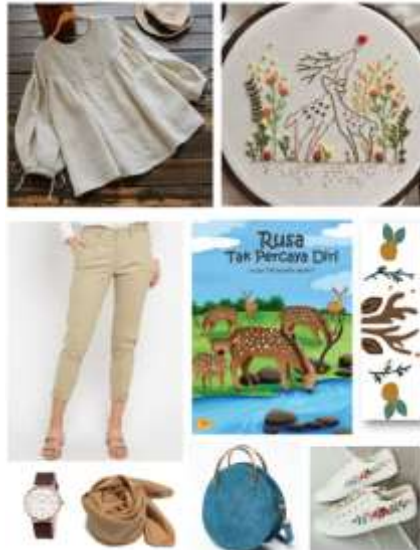
Gambar 3. Moodboard