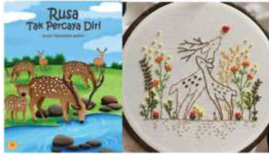
Gambar 1. Visualisasi dongeng “Rusa Tak Percaya Diri” dan contoh teknik sulaman Fantasi tokoh rusa dengan latar tempat hutan