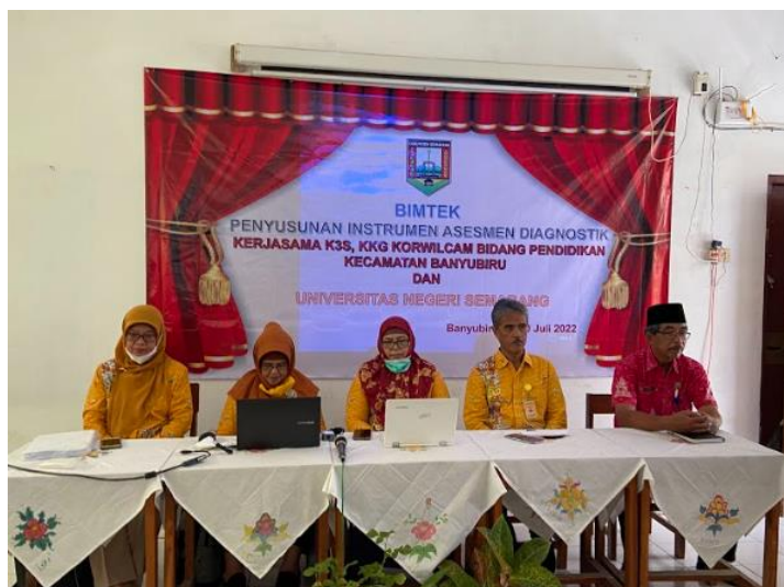
Gambar 1. Suasana Pembukaan Kegiatan Bimtek, Rabu (13/7/2022)

Metode yang digunakan dalam artikel ini menggunakan analisis deskriptif kuantitatif & kualitatif. Analisis kuantitatif menggunakan skala likert (skala 1-4). Analisis kualitatif menggunakan teknik analisis meliputi pengumpulan data, reduksi data, penyajian data dan penarikan kesimpulan (Hastuti, 2010). Pengabdian masyarakat dari prodi PEP UNNES dalam bentuk pendampingan, dimulai dari identifikasi masalah berupa praktik dalam penilaian yang telah dilakukan sebelumnya dan pemahaman mengenai dasar teori prosedur yang akan dilakukan. Pelaksanaan pengabdian ini menggunakan teori Seven-Stage Model of Program Planning and Development yang dikembangkan oleh Welsh, yang terdiri atas tahapan (Welsh, 2004) sebagai berikut : (1) analisa persoalan berupa pemetaan kondisi awal tentang berbagai hal yang