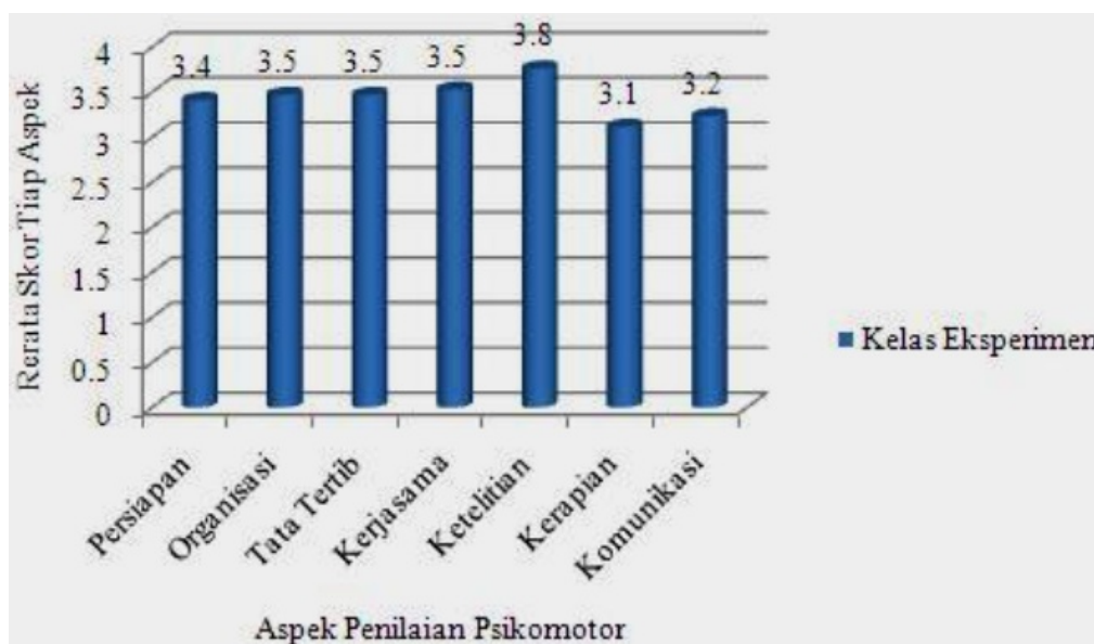
Gambar 1. Penilaian Psikomotorik Kelas Eksperimen

Hasil pengamatan aspek psikomotor peserta didik yang dilakukan pada tujuh aspek diperoleh rata-rata nilai pada dua kelas adalah 85,88 dengan kriteria baik. Hasil rata-rata nilai psikomotor tiap aspek pada kelas eksperimen disajikan pada Gambar 1.