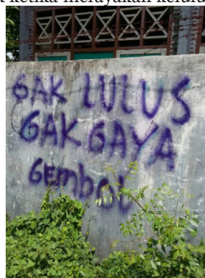
Gambar 1. Coretan Dinding Pagar Sekolah Menggunakan Pилоk

Membuat coretan dalam perayaan kelulusan dapat dilihat dari sudut pandang positif dan negatif. Dari sudut pandang positif misalkan E. A(19 th ) mengakui bahwa mencoret seragam OSIS merupakan perilaku yang sangat wajar dilakukan. Jika perayaan kelulusan dilakukan tanpa adanya coretan baju, hal tersebut berarti kurang bisa disebut sebagai perayaan kelulusan ujian. Sedangkan coretan dari sudut pandang negatif yang dimaksud ialah coretan yang dibuat pada ruang publik ketika merayakan kelulusan ujian.