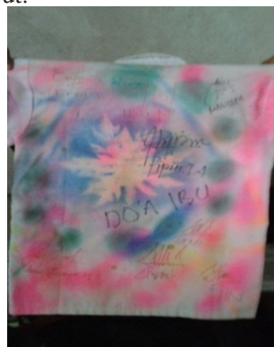
Gambar 2. Coretan Seragam S. N. W (19 th )

Coretan bisa dibuat menggunakan pilok dan tanda tangan. Jika yang digunakan pilok maka memberikan kesan yang warna-warni dalam menempuh sekolah selama tiga tahun. Namun untuk tanda tangan, bisa dijadikan ukiran kenangan dari orang yang spesial bagi siswa yang merayakan kelulusan ujian. Seragam yang dicoret disimpan sebagai bentuk kenangan yang suatu saat bisa dilihat kembali melalui seragam tersebut.