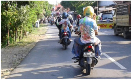
Gambar 2. Konvoi di Jalan Pantura

Jalur konvoi semula disepanjang jalan pantura yaitu dari Jln. Gajah Mada menuju Lasem, namun jalur diubah oleh Polisi mulai dari sepanjang jalan dari Jln. Gajah Mada, menuju Pasar Pentungan, kemudian belok ke arah selatan menuju Desa Waru, ke Jln. Raya Rembang – Blora menuju Pamotan, kemudian Lasem hingga sampai Rembang lagi. Alasannya agar tidak mengganggu kenyamanan masyarakat yang berkendara di jalan pantura. Siswa dari jurusan Konstruksi Kayu sempat ditegur warga desa Landoh karena berekspresi berlebihan dengan melepas seragam OSIS dan berteriak.