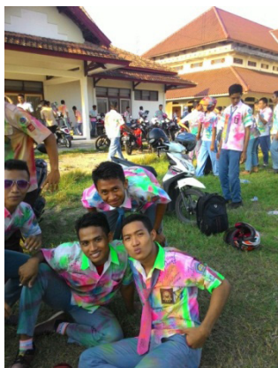
Gambar 3. Lokasi utama Perayaan Kelulusan Ujian

Gambar diatas merupakan foto siswa SMK Negeri 1 Rembang yang berkumpul di lokasi utama yaitu halaman Gedung Haji yang terletak di Jl. Pemuda KM 03 Rembang. Keramaian di lokasi tersebut menimbulkan pendapat dari masyarakat sekitar, begitu juga dengan teori interaksionisme simbolik bahwa masyarakat sekitar berhak memberikan respon terhadap apa yang dilakukan aktor utama yaitu siswa SMK Negeri 1 Rembang.