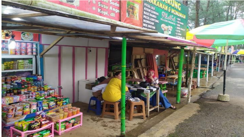
Gambar 2. Interaksi antar pedagang

Selain itu adanya relokasi meningkatkan komunikasi antar pedagang. Adanya hubungan antar pedagang satu dengan pedagang lain merupakan reaksi yang ditimbulkan karena adanya kontak secara langsung maupun secara tidak langsung (Junaidi, dkk. 2018:6). Jarak kios yang sangat dekat antar pedagang membuat interaksi yang terjadi semakin sering. Komunikasi dilakukan saat sedang tidak ada pengunjung ataupun ketika berbagi orderan dengan pedagang lain. Hal ini seperti yang dikatakan oleh Sutarni (51 Tahun) sebagai berikut: