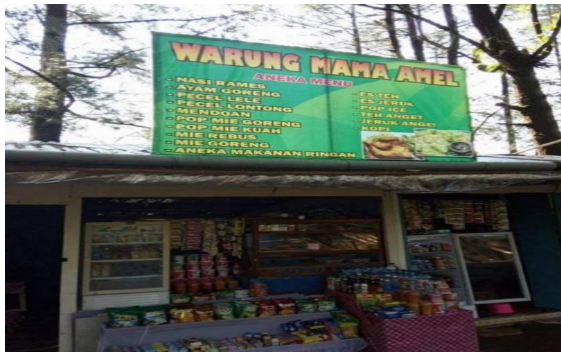
Gambar 1. Letak Banner pada Kios Pedagang

Manfaat banner bagi pedagang yaitu sebagai identitas kios serta media promosi. Menurut Zamri (2017:42), mengatakan bahwa para pedagang menawarkan barang dagangannya dengan berbagai macam cara yaitu lebih aktif dalam mempromosikan barang dagangannya, menggunakan alat bantu seperti poster atau banner dengan tulisan yang unik dan sebagainya. Pemasangan banner tersebut sebagai sarana promosi utama agar lebih dikenal oleh masyarakat sekitar (Andrian & Leonardo, 2019:96). Pindahan lokasi pedagang yang dijadikan disatu tempat memberikan dampak yang besar bagi pedagang. Salahsatunya kehilangan pelanggan. Hal tersebut menjadi permasalahan yang ditakutkan setiap pedagang ketika akan direlokasi yaitu kehilangan pelanggan (Steel, dkk., 2014:57). Adanya pemasangan banner mempermudah pelanggan untuk menemukan kios yang baru.