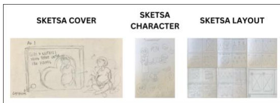
Gambar 3. Sketsa Manual

Visualisasi tahap awal dilakukan dalam bentuk sketsa manual berupa sketsa cover , sketsa character , dan sketsa layout . Berikut adalah tampilan dari sketsa manual yang dihasilkan: