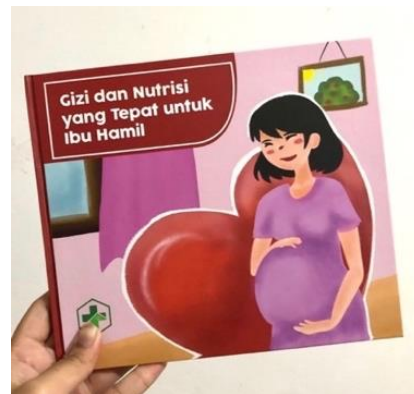
Gambar 6. Prototype

Pada tahap prototype , desain dicetak sebagai output yang dapat dipegang dan dibaca secara langsung. Buku ilustrasi ini menggunakan hard cover dengan laminasi doff , sedangkan untuk isi halaman menggunakan matte paper dengan ketebalan 150 gsm. Dalam proses pencetakan, setiap sisi halaman memiliki bleed sebesar 0,5 cm. Layout pada buku ilustrasi ini memiliki ukuran 21x18 cm dengan margin sebesar 1,27 cm.