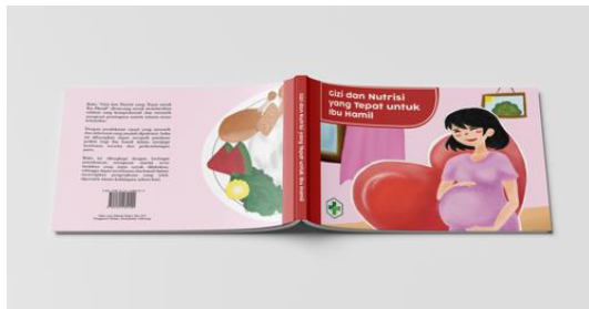
Gambar 7. Final Artwork

Sketsa digital yang telah dibuat kemudian difinalisasi menjadi final artwork , yang berukuran 21x18 cm serta memiliki 20 halaman, dengan menggunakan font serif dan sans serif , dengan gaya ilustrasi kartun dan tone warna yang cerah. Desain ini menggunakan layout yang minimalis dengan grid manuscript dan grid hierarchical pada layout , serta menerapkan prinsip dan elemen desain sesuai dengan konsep yang telah ditentukan.