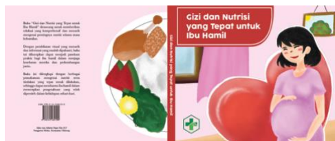
Gambar 4. Cover

Desain sketsa manual kemudian di digitalisasi hingga membentuk tampilan desain layout yang lengkap. Berikut adalah tampilan dari sketsa digital yang dihasilkan: