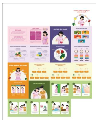
Gambar 5. Halaman Isi