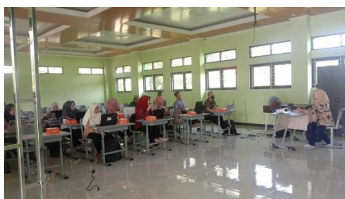
Gambar 2. Pelaksanaan kegiatan pengabdian pada hari ke 2, Jumat 4 Agustus 2023.

tingkat SMA/K di Kabupaten Semarang. Tahapan ini meliputi persiapan peralatan penunjang dan pelaksanaan kegiatan. Pelaksanaan kegiatan ini berupa agenda pelatihan. Sebelum melakukan pelatihan, tim pengabdian melakukan tanya jawab sebagai bahan evaluasi pelatihan. Pelatihan tersebut meliputi pelatihan penyusunan artikel jurnal, pelatihan mendeley untuk memudahkan sitasi, pelatihan mencari referensi jurnal, dan pelatihan untuk submit jurnal dengan narasumber ahli dan tim pengabdian. Pada tahap pelatihan ini, narasumber dan tim pengabdian mengajarkan langkah pembuatan artikel ilmiah yang kemudian dipraktikkan langsung oleh peserta yang hadir. Tim pengabdian berperan menjelaskan, memberikan pelatihan, serta mendampingi masyarakat untuk mempraktikkan pembuatan artikel ilmiah. Setelah pelatihan dilakukan, dilanjutkan dengan evaluasi peningkatan keterampilan pembuatan artikel ilmiah.