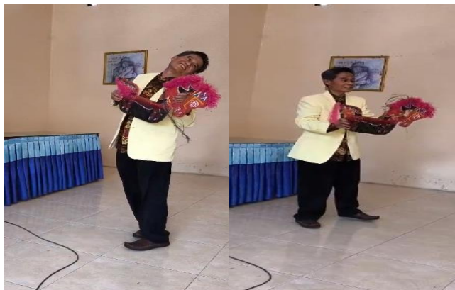
Foto 3. Pembelajaran menyenangkan, menantang dan memotivasi