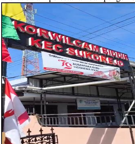
Foto 1. Tempat kegiatan pengabdian di Korwilcam Kecamatan Sukorejo

Di Indonesia, pemajuan kebudayaan juga menjadi bagian dari kebijakan nasional dalam rangka melestarikan kekayaan budaya Nusantara yang beragam. Pengembangan dan pelestarian dalam upaya pemajuan kebudayaan dengan merujuk pada upaya sistematis dan terencana untuk mengembangkan, memelihara, melestarikan, dan mempromosikan unsur-unsur kebudayaan yang ada di suatu masyarakat atau bangsa. Pemajuan kebudayaan bertujuan untuk menjaga nilai-nilai budaya, mengadaptasi perkembangan zaman tanpa menghilangkan identitas kultural, serta meningkatkan partisipasi masyarakat dalam pelestarian dan pengembangan warisan budaya.