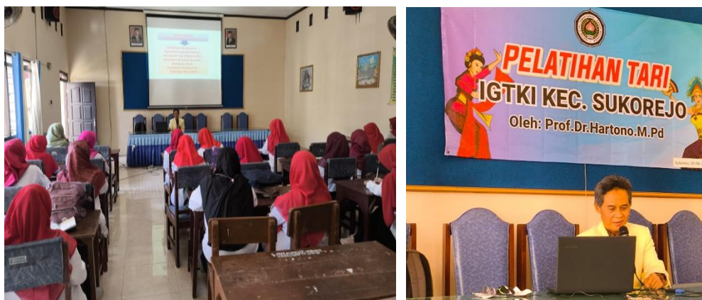
Foto 2. Pemaparan materi dalam peningkatan Kompetensi Pedagogik

Pada hakikatnya bahwa kompetensi pedagogik adalah kemampuan yang dimiliki oleh seorang guru seni tari dalam mengelola pembelajaran secara efektif untuk mendukung perkembangan dan pembelajaran siswa. Kompetensi ini berkaitan dengan bagaimana guru merancang, melaksanakan, mengevaluasi, serta meningkatkan proses pembelajaran sesuai dengan kebutuhan dan karakteristik siswa. Kompetensi pedagogik juga mencakup berbagai aspek yang penting untuk memastikan pembelajaran berlangsung secara efektif, relevan, dan bermakna berkaitan dengan Tari Kuda Kepang. Saat guru menyampaikan Tari Kuda Kepang hendaknya guru mempunyai pemahaman karakteristik peserta didik. Diantaranya guru memahami berbagai aspek psikologis dan perkembangan siswa, seperti usia, kemampuan belajar, latar belakang sosial-budaya, serta gaya belajar individu. Mengidentifikasi kebutuhan khusus peserta didik, termasuk mereka yang memiliki kebutuhan khusus atau beragam kemampuan. Guru tari dituntut memiliki kemampuan merancang pembelajaran, yaitu kemampuan guru dalam merancang Rencana Pelaksanaan Pembelajaran (RPP) yang sesuai dengan kurikulum dan tujuan pembelajaran. Mengembangkan strategi, metode, dan media pembelajaran yang bervariasi dan menarik, sesuai dengan kebutuhan dan potensi siswa. Guru tari dapat menentukan langkah-langkah pembelajaran yang sistematis dan logis agar proses belajar mengajar berjalan dengan baik.