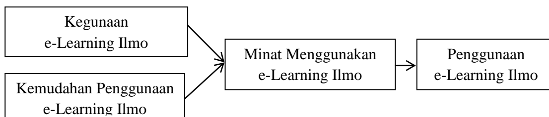
Gambar 2. Kerangka Pemikiran Teoritis Penggunaan e-Learning Ilmo Untuk Meningkatkan Mutu Perkuliahan

Selanjutnya berpijak pada dukungan empiris hasil-hasil penelitian terdahulu yang menyatakan bahwa: (1) Kegunaan persepsian berpengaruh positif dan signifikan terhadap minat pengguna menggunakan suatu teknologi sistem informasi (Chau, 1996; Iqbaria et al., 1997; Sun, 2003 dan Asrori, 2009); (2) Kemudahan penggunaan persepsian berpengaruh positif dan signifikan terhadap minat menggunakan suatu teknologi sistem informasi (Agarnal dan Prrasad, 1998; Vander hujden, 200; Sun, 2003); (3) Minat menggunakan teknologi sistem informasi merupakan prediksi yang baik dari penggunaan sesungguhnya dari teknologi sistem informasi (Taylor dan Todd, 1995; venkatesh dan Davis, 2000). Kerangka pemikiran teoritis penggunaan e-Learning ilmo untuk meningkatkan mutu perkuliahan di Fakultas Ekonomi Unnes disajikan sebagai berikut: