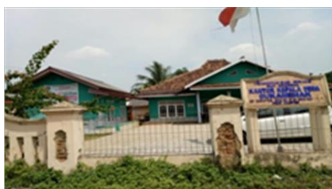
Gambar 2. Kantor Desa Sukamenak Kecamatan Cikeusal

Kegiatan sosialisasi program yang diadakan pada tanggal 05 Agustus 2017 ini dihadiri oleh kepala desa, ketua BPD dan masyarakat bertempat di Kantor Kepala Desa Sukamenak. Respon yang diberikan masyarakat terhadap kegiatan ini sangatlah antusias dan mendorong agar kegiatan pelatihan dapat dilaksanakan secara berkelanjutan. Selanjutnya kepala desa dalam sambutannya mengharapkan agar kegiatan