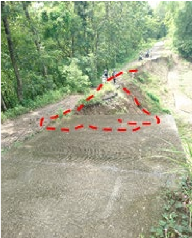
Gambar 5. Longsor akibat pemotongan lereng

agar bisa dimanfaatkan untuk menunjang perekonomian.