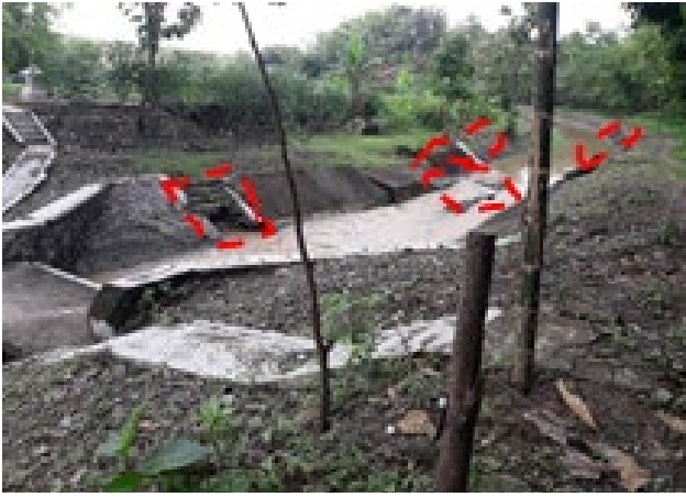
Gambar 4. Bangunan irigasi yang rusak