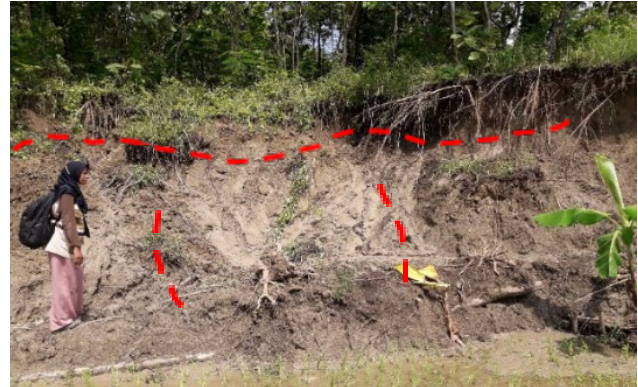
Gambar 3. Longsor tebing

setempat didapatkan informasi bahwa setiap terjadi hujan tanah selalu bergerak. Apabila hujan yang terjadi besar, maka aliran sungai akan membawa material lumpur tanah yang dapat menutup aliran sungai. Banjir luapan juga terjadi dan menggenangi area persawahan warga di bagian bawahnya.