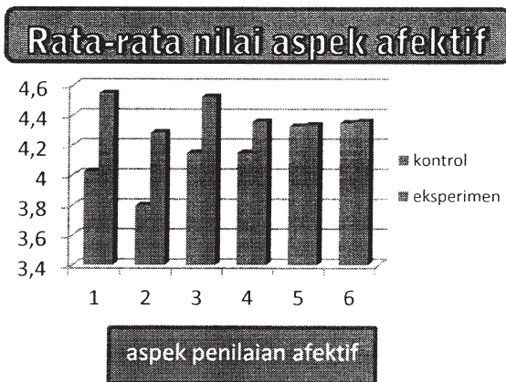
Gambar 1. rata-rata nilai untuk aspek afektif siswa

Pada grafik diatas kelompok eksperimen lebih tinggi dari kelas kontrol pada tiap-tiap aspek. Hal ini membuktikan kelas eksperimen lebih baik dari kelas kontrol. Selain itu presentase hasil belajar afektif pada kelas kontrol mencapai 78,50%. Hal ini menunjukkan bahwa perhatian dalam mengikuti pelajaran, keaktifan bertanya dan menjawab, disiplin mengerjakan tugas, kerjasama, kejujuran, toleransi siswa terhadap siswa lain, kehadiran dan kemampuan bekerjasama dengan anggota kelompoknyadapat dikategorikan baik.