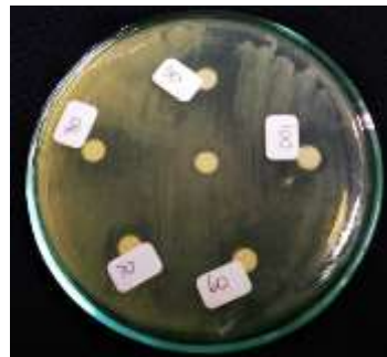
Gambar 3. Uji Nanokomposit ZnO-Ag terhadap Escherichia coli penghasil ESBLs.

fenotipik dikenali pada sel inangnya. Pada umumnya, plasmid R adalah plasmid konjugatif dan mengandung gen yang dapat menyebabkan sel bakteri resisten terhadap sejumlah antibiotik, seperti sulfonamida, streptomisin, kloramfenikol, kanamisin, dan tetrasiklin (Prasetya 2018). Plasmid R yang lain diduga juga mengandung gen resistensi terhadap logam berat, seperti merkuri, kobalt, kadmium, tembaga, arsenik, zink, perak, antimoni, tellurium, dan kromium, serta resistensi terhadap toksin seluler. Mayoritas faktor R mengandung dua kelompok gen, yaitu faktor transfer resistensi ( resistance transfer factor , RTF) yang mencakup gen untuk replikasi plasmid dan konjugasi, dan determinan r ( r-determinant ) yang memiliki gen resistensi dan mengkode produksi enzim untuk inaktivasi obat-obat tertentu atau senyawa toksik (Prasetya 2018).