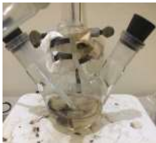
Gambar 1. Hasil nanokomposit ZnO-Ag dengan metode refluks

pada temperatur reaksi 90°C. ZnO yang terbentuk memiliki bentuk fiber, sedangkan partikel Ag berbentuk kubus. Berdasarkan spektrum EDX terdapat unsur Zn (10,6%), Ag (9,04%), dan O (80,35%). Presentase kecil Ag pada nanokomposit tersebut menunjukkan bahwa nanopartikel tersebut mampu menempel pada permukaan partikel ZnO (Azizi et al. 2016).