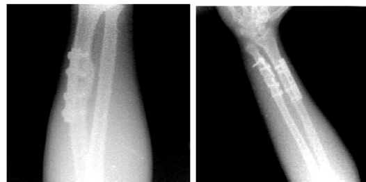
Gambar 10. Radiograf fraktur tulang beberapa objek

Foto citra radiograf jenis digital ini mempunyai dimensi 320 x 240 pixel, jenis Bitmap Image, dengan ukuran 225 kB. Ini disebabkan karena penangkap gambar menggunakan camera CCD. Ukuran citra tersebut cukup kecil, sehingga mudah dikirim menggunakan fasilitas SMS, MMS, atau internet. Namun foto tersebut dibanding dengan hasil kamera yang terkini dianggap kecil sehingga masih bisa ditingkatkan dengan cara lain.