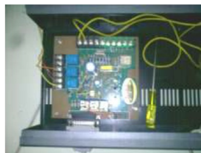
Gambar 5. Rangkaian interface yang menghubungkan control table dan PC.

Kegiatan keempat adalah setting system RK milik RSPAW di ruang radio-diagnostik menjadi sistem RD dengan cara menggabungkan sistem RK tersebut dengan tabung penangkap gambar kedap cahaya bersama rangkaian interface, seperti ditunjukkan pada Gambar 7.