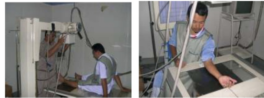
Gambar 9. Pemotretan fraktur tulang pada kaki dan tangan

ditunjukkan pada Gambar 10. Radigraf tersebut dipotret dengan faktor eksposi 40 kV 0,1 mAs, faktor eksposi dengan dosis paparan yang cukup rendah.