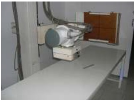
Gambar 1. Sistem RD yang telah dibangun pada tahun pertama.

Sistem RD yang dibangun sudah bisa dioperasikan dalam skala lab., seperti ditunjukkan pada Gambar 1 dan Gambar 2. Sistem ini dapat diaplikasikan dalam bidang medis di RS.