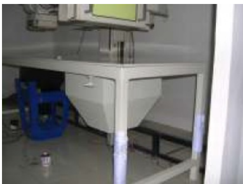
Gambar 2. Meja pasien dan tabung kedap cahaya yang dibangun pada tahun pertama

Prinsip dari radiografi digital adalah memanfaatkan perbedaan penyerapan sinar-X pada bagian-bagian tulang dan jaringan lainnya (Kotter 2002). Pada tulang padat, sinar-X yang diserap lebih banyak sehingga sinar yang datang ke intensifying screen menjadi berkurang mengakibatkan gambaran tulang menjadi lebih putih dibanding dengan jaringan tulang lainnya. Oleh karena itu gambaran jaringan tulang yang densitasnya berbeda dengan tulang normal ditampilkan berbeda pula pada layar tampilan gambar.