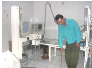
Gambar 7. Sistem RD hasil modifikasi sistem RK di RSPAW Salatiga

Kegiatan kelima adalah uji coba final dengan menggunakan sistem RD yang dibangun di bagian Radiologi RSPAW Salatiga. Dengan berbagai variasi objek (stepwedge, phantom, volunter dll) dan juga berbagai variasi faktor ekspose (kV, mA, mAs, jarak) dihasilkan citra radiografi. Beberapa hasil radiograf ditunjukkan pada Gambar 8.