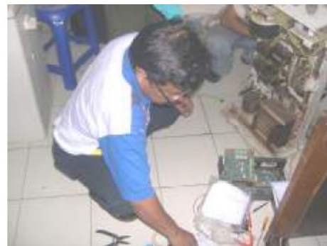
Gambar 4. Pemasangan rangkaian interface pada unit Control Table oleh tim peneliti

Kegiatan ketiga adalah kegiatan mengurus perizinan dan mematangkan kerjasama penelitian dengan tim peneliti dari pihak RSPAW Salatiga, sambil meninjau keadaan di bagian Radiologi tempat dimana modifikasi sistem RD akan dilakukan (Gambar 6).