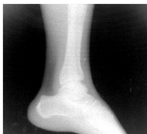
Gambar 8. Radiograf kaki volunter tulang normal.

Kegiatan kelima adalah uji coba final dengan menggunakan sistem RD yang dibangun di bagian Radiologi RSPAW Salatiga. Dengan berbagai variasi objek (stepwedge, phantom, volunter dll) dan juga berbagai variasi faktor ekspose (kV, mA, mAs, jarak) dihasilkan citra radiografi. Beberapa hasil radiograf ditunjukkan pada Gambar 8.