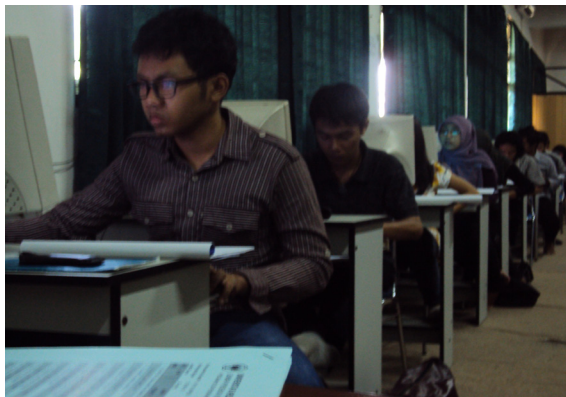
Gambar 2 Aktivitas mahasiswa

Pada siklus kedua, minat mahasiswa terhadap materi perkuliahan meningkat dari cukup menjadi sangat baik, hal ini dapat dilihat pada keseriusan mahasiswa dalam proses pembelajaran. Aktifitas mahasiswa dalam proses pembelajaran dapat dilihat pada gambar berikut.