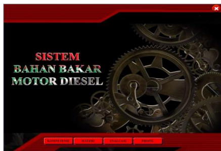
Gambar 2. Desain tampilan multimedia

awal yang dilakukan adalah: 1. Penyusunan tes, penyusunan instrumen yang berupa tes digunakan untuk mengukur kemampuan dasar dan pencapaian atau prestasi. adalah menyusun instrumen soal tes, instrumen validasi ahli media dan materi, 2. Pemilihan media, pada tahap ini multimedia dibuat dengan software Macromedia Flash Profesional 8, 3. Pemilihan format, pemilihan format berkaitan erat dengan pemilihan media, format yang dipilih sesuai dengan kisi-kisi penilaian pada angket validator, di antaranya adalah menentukan layout, gradasi warna yang digunakan, desain tampilan, 4. Desain awal, tahapan pada desain awal adalah membuat desain awal antara lain: 1. membuat desain isi media, 2. Membuat desain story board, 3. desain diagram alir, 4. desain pada multimedia (halaman opening, halaman kompetensi, halaman materi, halaman evaluasi, halaman profil).