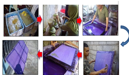
Gambar2. Proses pembuatan kertas handmade dengan variasi metode cetakan motif

Bahan baku limbah pelepah pisang dan limbah kertas harus melalui beberapa perlakuan untuk menjadi pulp sebelum dicetak. Diketahui bahwa pelepah pisang merupakan limbah pertanian yang sangat berpotensi untuk bahan baku pembuatan kertas handmade . Disamping itu, penggunaan campuran limbah kertas dan pelepah pisang menambah kekuatan dan tekstur kertas yang nantinya akan dihasilkan. Serat pisang mempunyai ketahanan yang tinggi terhadap kelembapan dan awet disimpan dalam jangka waktu yang lama. Pelepah pisang juga mempunyai kandungan selulosa yang tinggi yang merupakan komponen penting dalam pembuatan kertas. Proses Pembuatan kertas handmade berbahan baku pelepah pisang