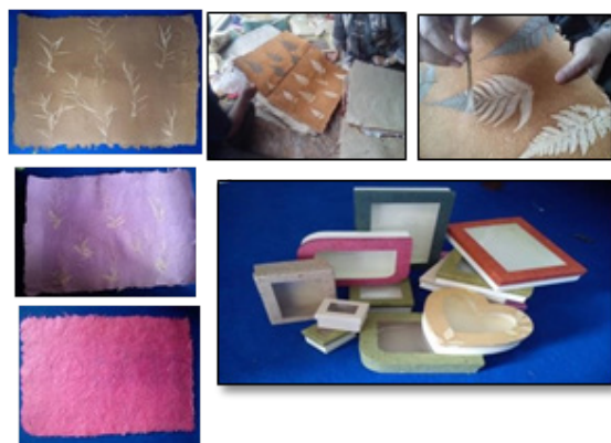
Gambar2. Kertas handmade dan produk berbahan baku kertas handmade

kertas kurang lebih 5 cm, (2) Merendam potongan limbah kertas dan pelepah dalam NaOH selama semalam, (3) Menghaluskan serat pelepah pisang menggunakan blender hingga terbentuk pulp (bubur serat), (4) Menampung pulp pada bak tampung, (5) Mewarnai pulp kemudian menyiapkan cetakan, (6) Mencetak kertas, (a) Memasukkan pulp pelepah pisang ke dalam bak cetak berisi air bersih dan diaduk hingga merata, (b) Mengambil pulp menggunakan screen (ketebalan pulp diusahakan merata pada seluruh screen ), (c) Menempelkan screen pada papan triplek dan dikesut hingga kandungan air pada pulp habis, (d) Mengangkat screen dengan sedikit ditekan terlebih dahulu agar serat menempel di papan, (e) Menjemur kertas di bawah terik matahari sampai kering, diusahakan agar kertas.