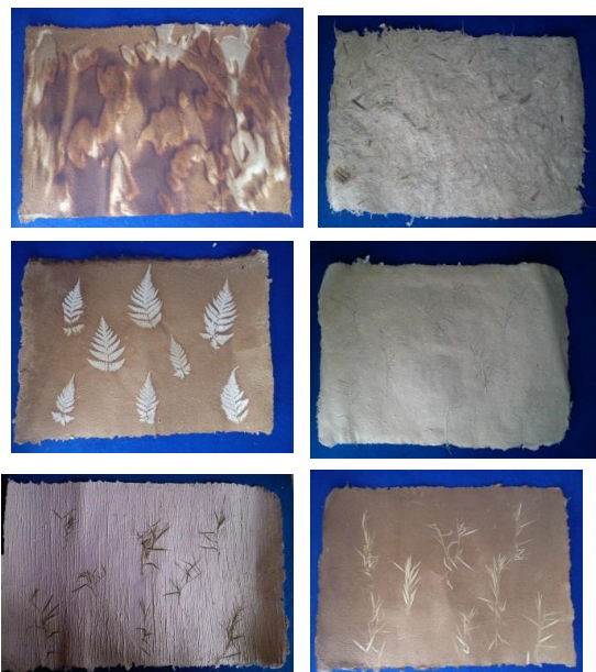
Gambar1. Kertas handmade yang dihasilkan

Penunjang lain seperti ketersediaan alat juga turut andil dalam proses peningkatan kualitas dan kuantitas produksi kertas ini. pemanfaatan limbah kertas dan serat alam ini selain mengurangi penumpukan limbah kertas juga merupakan usaha kreatif yang memiliki peluang besar.