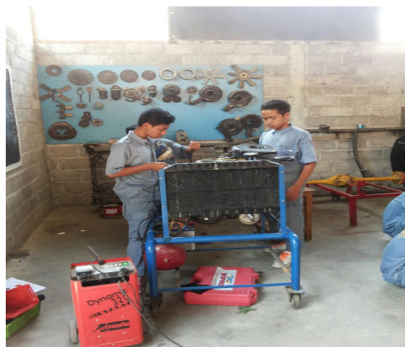
Gambar 1: Kunjungan Workshop Siswa

Analisa kebutuhan dikaitkan dengan kebutuhan siswa SMK untuk memenuhi kebutuhan dalam lapangan pekerjaan. Analisa kebutuhan dilakukan melalui wawancara dengan guru terkait, dan juga mengunjungi lokasi praktek siswa.