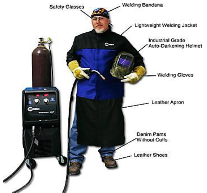
Gambar 5: Contoh Materi terkait Kosa Kata