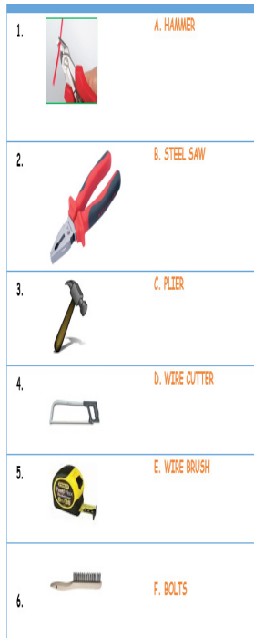
Gambar 3: Tools (Unit 1)

Arrange the following jumbled words into good sentences.