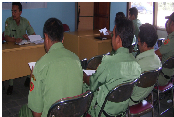
Gambar 1. Foto Proses dan Hasil Asesment Anggota BPD dan Perangkat Desa

Hasil perumusan peserta pelatihan mengenai bagan alir perencanaan strategis di bidang pertanian Desa Jetis, dapat ditampilkan sebagai berikut: