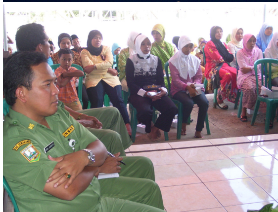
Gambar 4. Foto Penyerapan Aspirasi dan Identifikasi Potensi Desa

Konsep pengembangan wilayah dikembangkan dari kebutuhan suatu daerah untuk meningkatkan fungsi dan perannya dalam menata kehidupan sosial, ekonomi, budaya, pendidikan dan kesejahteraan masyarakat. Pengaruh globalisasi, pasar bebas dan regionalisasi menyebabkan terjadinya perubahan dan dinamika spasial, sosial, dan ekonomi antarnegara, antar daerah (kota/kabupaten), kecamatan hingga pedesaan.