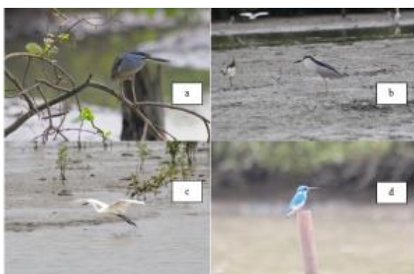
Gambar 1. Beberapa jenis burung memanfaatkan lahan basah di KPHL Gunung Balak untuk beraktivitas. (a) Kokokan Laut ( Butorides striata ); (b) Kowak-malam Abu ( Nycticorax Nycticorax ); (c) Kuntul Kecil ( Egretta Garzetta ); (d) Raja-udang Biru ( Alcedo Coerulescens ).

daftar Appendix CITES hanya Myctaria cinarea dengan kategori AI ( Appendix I ), sehingga dilarang untuk diperdagangkan. Sementara itu, terdapat 10 jenis burung (Tabel 1) yang dilindungi dalam peraturan perundangan (UU/PP/PERMEN. LHK), sehingga keberadaan burung-burung tersebut menjadi perhatian dan prioritas pemerintah Indonesia untuk mempertahankannya dari ancaman perburuan, perdagangan dan perusakan habitat. Selain itu, keberadaan jenis-jenis tersebut di hutan mangrove KPHL Gunung Balak mengindikasikan bahwa kawasan hutan mangrove tersebut merupakan lahan basah penting yang perlu dijaga kelestariannya.