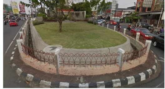
Gambar 4. Saluran drainase di Taman Madukoro