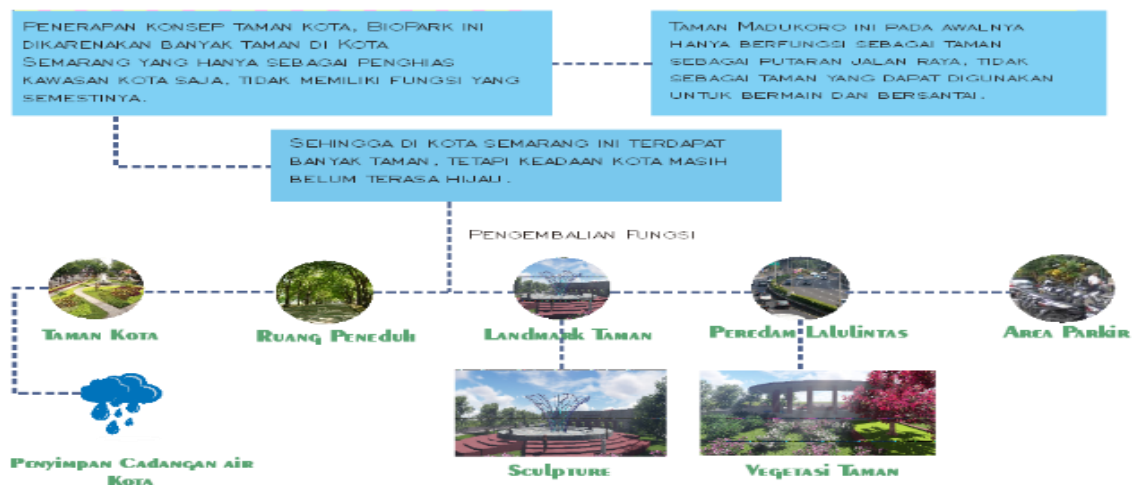
Gambar 9. Penerapan Konsep Desain Biopark di Taman Madukoro