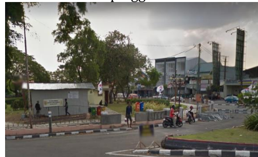
Gambar 6. Area Parkir di Taman Madukoro