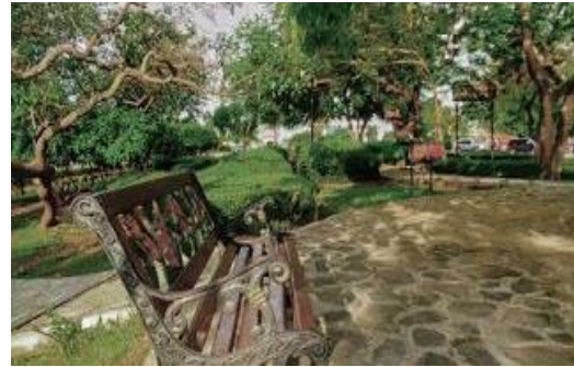
Gambar 8. Kursi yang ada di Taman Madukoro