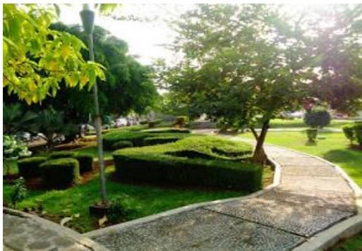
Gambar 3. Jalur Pedestrian di Taman Madukoro