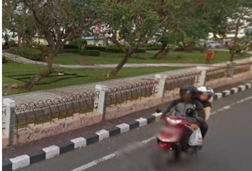
Gambar 7. Area Trotoar yang ada di Taman Madukoro