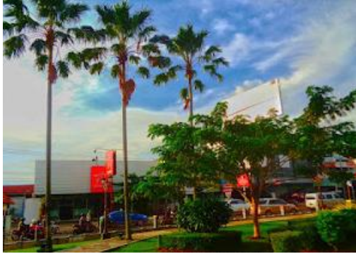
Gambar 2. Pohon Palem di Taman Madukoro