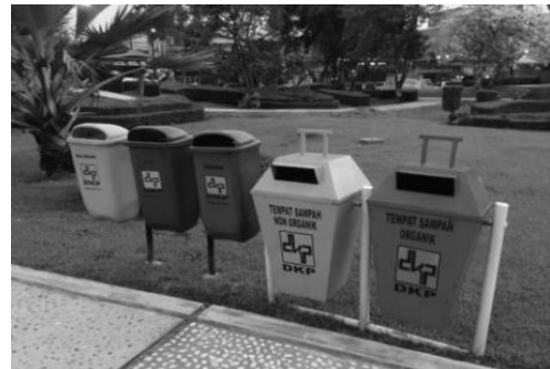
Gambar 5. Tempat Sampah di Taman Madukoro