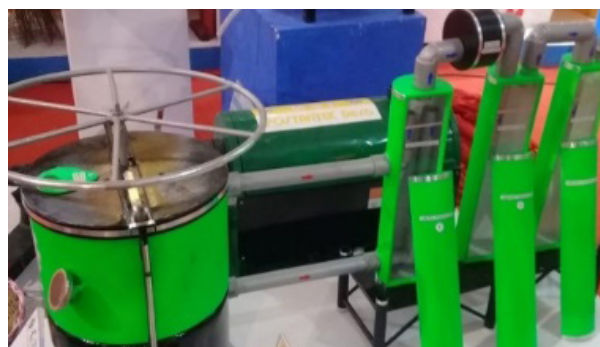
Gambar 2. Hot Mixer Paving Block Manual

Melalui metode pengelolaan dan penanganan dengan jenis insinerasi, sampah plastik dapat dibakar dan dilebur sehingga dapat dibentuk menjadi paving block. Namun, mesin insinerasi ini dinilai cukup memakan biaya. Adapun mesin insinerasi sederhana buatan warga namun kerap kali menghasilkan asap yang dapat membahayakan orang disekitar tempat pembakaran.