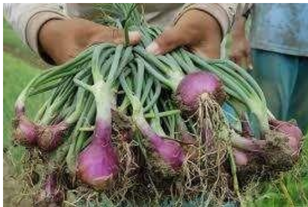
Gambar 1. Umbi Basah