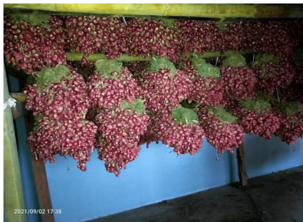
Gambar 3. Umbi Bawang Merah di Gudang Penyimpanan

Pemanenan sebaiknya dilaksanakan pada keadaan tanah kering dan cuaca yang cerah untuk mencegah serangan penyakit busuk umbi di gudang. Bawang merah yang telah dipanen kemudian diikat pada batangnya untuk mempermudah penanganan. Selanjutnya umbi dijemur sampai cukup kering (1-2 minggu) dengan dibawah sinar matahari langsung, kemudian biasanya diikuti dengan pengelompokan berdasarkan kualitas umbi. Pengeringan juga dapat dilakukan dengan alat pengering khusus sampai mencapai kadar air kurang lebih 80%. Apabila tidak langsung dijual, umbi bawang merah disimpan dengan cara