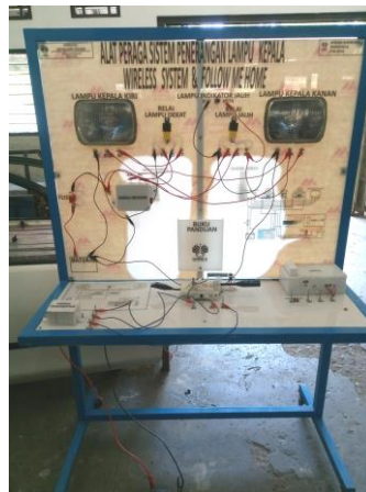
Gambar 1. Alat peraga wireless headlamp system

maksimal 112. Setelah disesuaikan dengan skala tanggapan skor tersebut masuk dalam nilai 71-91 dengan kategori layak . Selanjutnya, perolehan skor total dari kedua ahli materi diperoleh skor sebesar 127 dari skor maksimal 144. Setelah disesuaikan dengan skala tanggapan, skor tersebut masuk dalam kriteria nilai 118-144 dengan kategori sangat layak . Dari hasil penilaian kedua ahli media dan ahli materi dapat disimpulkan bahwa alat peraga wireless headlamp system dikatakan sangat layak .