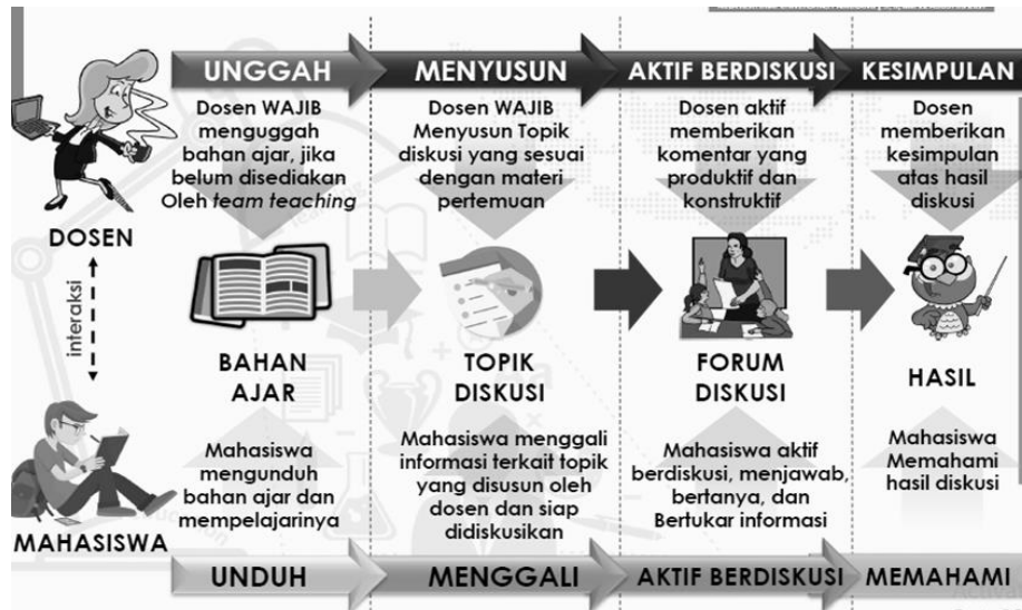
Gambar 2. Aktivitas dosen dan mahasiswa pada perkuliahan e-learning

diskusi online. Dengan demikian terdapat perkuliahan online dengan proporsi 30% - pengurangan tatap muka dengan diganti 70% .