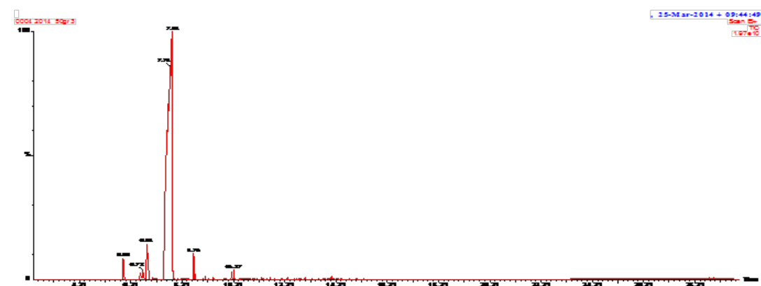
Gambar 3. Kromatograf Minyak Kulit Jeruk Hasil Ekstraksi pada Kondisi non Vakum