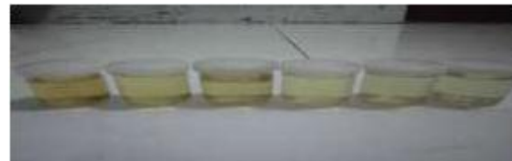
GAMBAR 4. Hasil perendaman air sabun

sabun dengan perbandingan volume yang semakin meningkat, nilai transmitansi yang di hasilkan semakin besar pula. Sehingga semakin banyak pemberian getah pelepah pisang kepok terhadap pigmen alami kunyit nilai transmitansi mengalami peningkatan yang artinya nilai kelunturan semakin berkurang, hal ini di tunjukan oleh Gambar 3 dan Gambar 4.