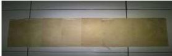
GAMBAR 2. Hasil pewarnaan pada kain

sehingga warna dari pigmen kunyit tertutupi pigmen dari pelepah getah pelepah pisang kepok (Jahanshaei & Tabarsa 2012, Sa'adah 2010), untuk menghasilkan nilai kelunturan yang rendah dan warna yang maksimal maka digunakan nilai perbandingan volume getah pelepah pisang sebesar 40%.