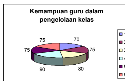
Gambar 1. Kemampuan Rata-rata Guru dalam Pengelolaan Kelas

baik, hal ini dirasakan cukup kondusif mengingat baru diterapkannya strategi ini dalam pembelajaran sains di sekolah tersebut.