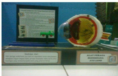
Gambar 1. Alat Peraga Sederhana Eye Lens

Untuk mengetahui kelayakan alat peraga sederhana eye lens dilakukan validasi kelayakan oleh pakar materi dan media. Instrumen penilaian kelayakan menggunakan instrumen kelayakan berdasarkan Kemendikbud yang telah dimodifikasi oleh peneliti. Aspek yang dinilai meliputi : (1) Keterkaitan dengan bahan ajar, (2) Nilai pendidikan, (3) Keterpaduan materi, (4) Keterampilan proses sains, (5) Kesesuaian dengan prinsip pengembangan, (6) Ketahanan alat, (7) Keakuratan alat, (8) Efisiensi alat, (9) Keamanan bagi peserta didik, dan (10) Estetika. Selain itu digunakan juga angket tanggapan guru dan peserta didik untuk mengetahui kelayakan alat peraga sederhana eye lens .