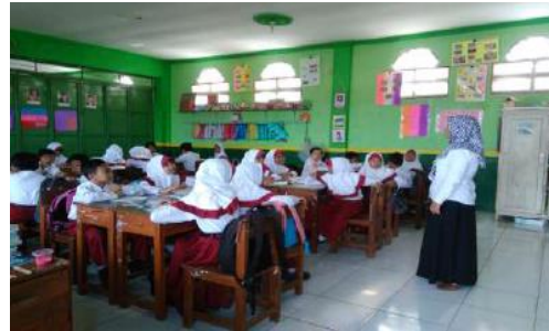
Gambar 3. Dokumentasi Pembelajaran di Kelas