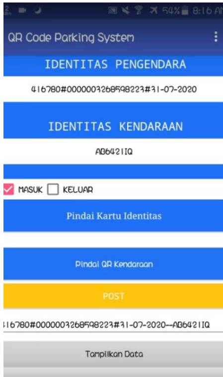
Gambar 7. Tampilan aplikasi saat masuk