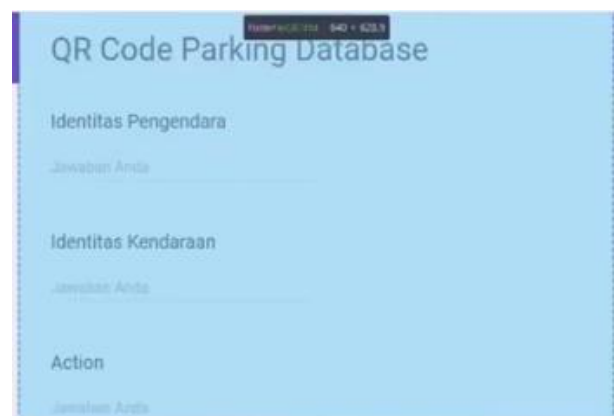
Gambar 4. Perancangan Google Form sebagai perantara aplikasi dan Google Spreadsheet