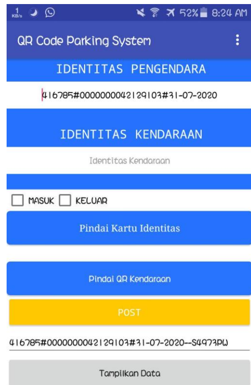
Gambar 3. Hasil perancangan aplikasi

pengemudi-kendaraan sesuai saat masuk tulisan “Data Hilang” tidak tertampil. Begitu juga bila pada saat keluar urutan pemindaian terbalik, kendaraan dulu baru pengemudi. Sistem akan membaca kalau hal ini tidak sesuai, sehingga tulisan “Data Hilang” tidak tertampil. Untuk keadaan-keadaan tertentu, petugas parkir berwenang untuk melakukan intervensi sistem secara manual, misalnya menghapus data kendaraan atau pengemudi. Namun agar intervensi yang dilakukan tetap bertanggung jawab, pilihan untuk intervensi dilindungi oleh kata sandi, dan hanya dapat dibuka oleh atasan petugas parkir.