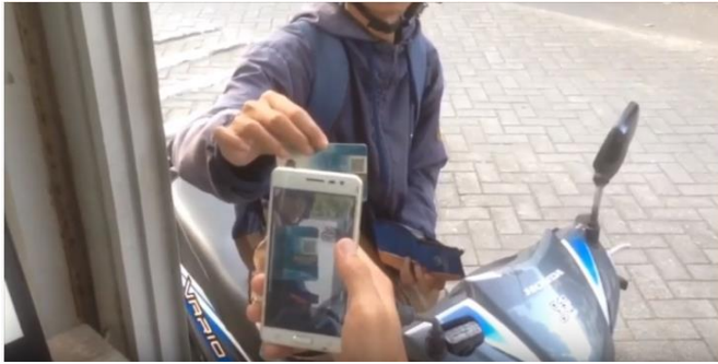
Gambar 5. Proses pemindaian identitas pengendara