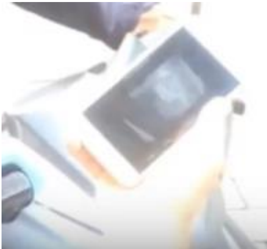
Gambar 6. Proses pemindaian di bagian depan kendaraan