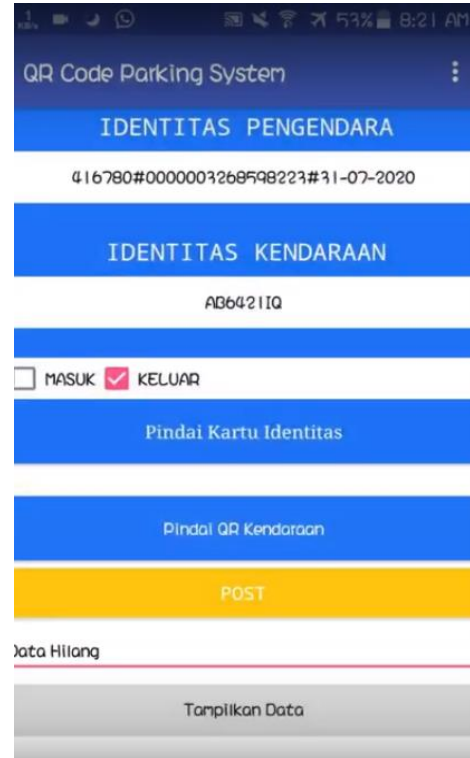
Gambar 9. Tampilan aplikasi saat pemasangan pengendara-kendaraan keluar sesuai

Waktu yang diperlukan untuk memindai 2 QR code (pengendara dan kendaraan) adalah selama 10 detik. Penggunaan QR code menjadikan sistem ini tidak memerlukan kertas yang hanya terpakai untuk sekali parkir, melainkan stiker permanen pada kendaraan. Proses verifikasi oleh petugas parkir tidak memerlukan waktu yang lama karena hanya melihat 1 indikator saja, yaitu munculnya tulisan “Data Hilang” pada ponsel pemindai. Hasil pengujian ditampilkan pada Tabel I.