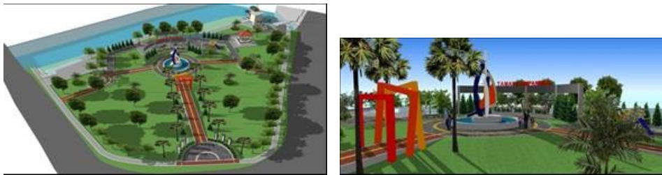
Gambar 2. Desain Taman Sampangan ( Sampangan Youth Park )