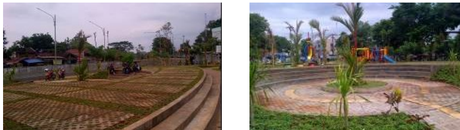
Gambar 4. Plaza Utama di Taman Sampangan