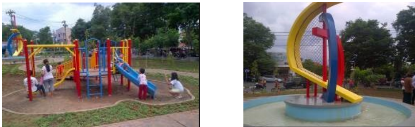
Gambar 3. Sculpture dan Arena Bermain Anak di Taman Sampangan