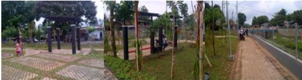
Gambar 6. Fasilitas Gazebo, Shelter dan Jalur Pedestrian di Taman Sampangan

Taman Sampangan didesain dengan konsep Taman Untuk Anak Muda / Youth Park, dengan tujuan sebagai Pusat Kegiatan anak muda di sekitar Kawasan Sampangan. Untuk menampung aktivitas yang ada, Taman Sampangan di desain dengan dilengkapi fasilitas seperti Plaza Utama, Jalur Pedestrian, Taman dengan berbagai macam tanaman yang bervariasi, Gazebo, Shelter, Tempat Parkir Sepeda, Bangunan Service dan Toilet, Sculpture dan Air Mancur, Solar Cell untuk penerangan Jalur Pedestrian serta Fasilitas WIFI untuk sambungan internet.