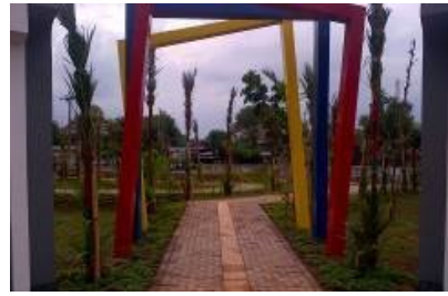
Gambar 5. Nama Taman dan Gerbang Utama di Taman Sampangan