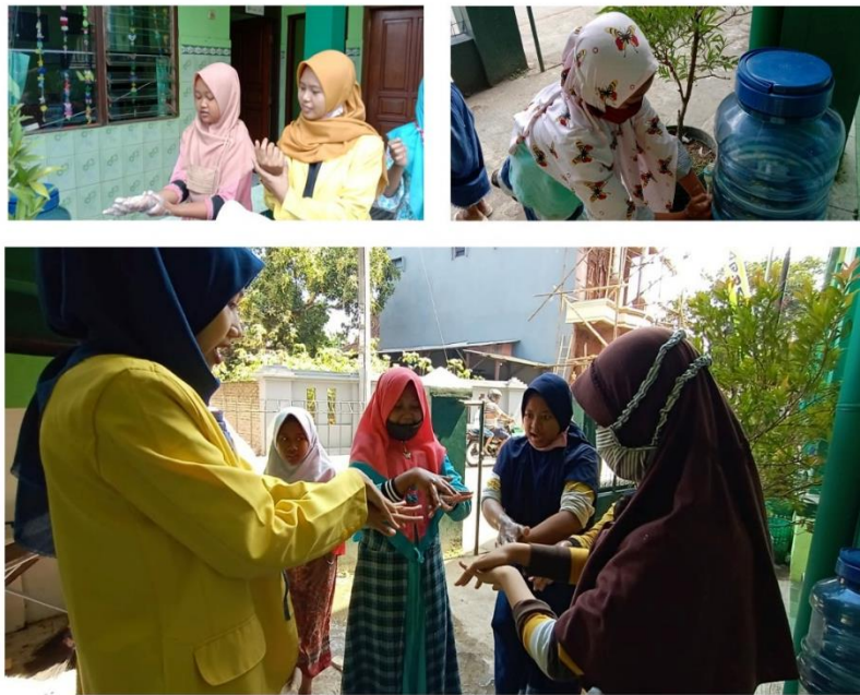
Gambar 6. Praktik Cuci Tangan Pakai Sabun