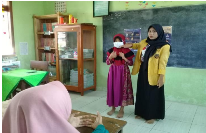
Gambar 3. Penyampaian Materi Tata Cara Memakai Masker