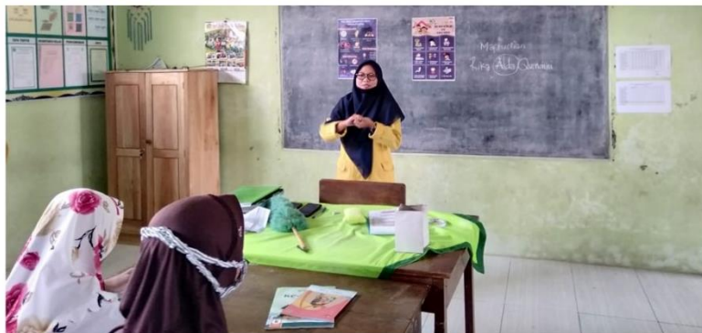
Gambar 5. Pemeragaan Cuci Tangan Menggunakan Sabun