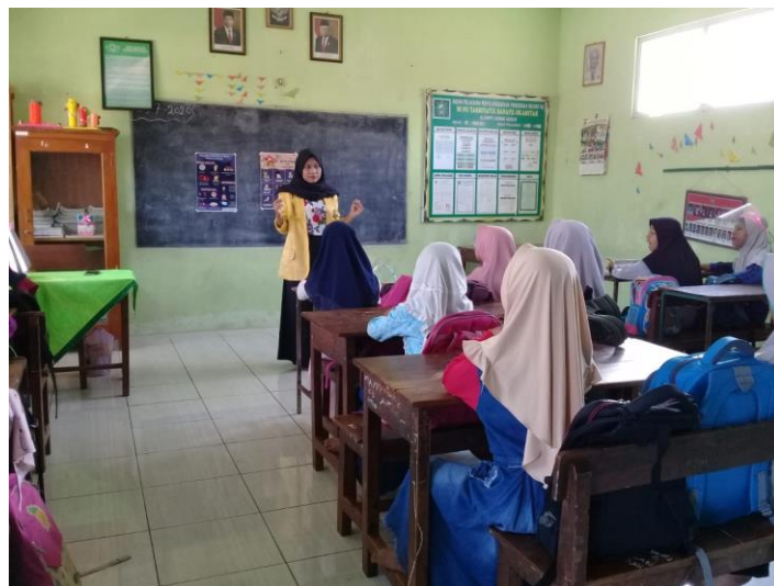
Gambar 2. Tahap Apersepsi

Tahap selanjutnya adalah praktik. Setelah para siswa mengetahui bagaimana langkah-langkah dalam mencuci tangan dengan benar, mereka kemudian diminta untuk mempraktikkan pengetahuan tersebut menggunakan air mengalir dan sabun yang sudah disediakan di depan sekolah (Gambar 6). Tidak semua siswa berperan dalam tahap ini, hanya 4 siswa terpilih yang mengikuti praktik cuci tangan pakai sabun dengan didampingi oleh satu penulis dari masing-masing kelas. Tahap terakhir dari kegiatan pengabdian ini adalah evaluasi. Tahap ini bertujuan untuk mengetahui apakah para siswa memahami betul materi mengenai PHBS. Evaluasi dilakukan secara lisan dengan cara melemparkan pertanyaan seputar materi yang telah disampaikan (Gambar 7). Siswa yang mampu menjawab pertanyaan dengan benar akan diberikan penguatan ( reinforcement ) berupa makanan ringan. Para siswa sangat antusias pada tahap ini. Hal ini ditandai dengan jumlah siswa yang mengangkat tangan pertanda hendak menjawab pertanyaan selalu lebih dari setengah populasi pada setiap pertanyaan yang penulis ajukan.