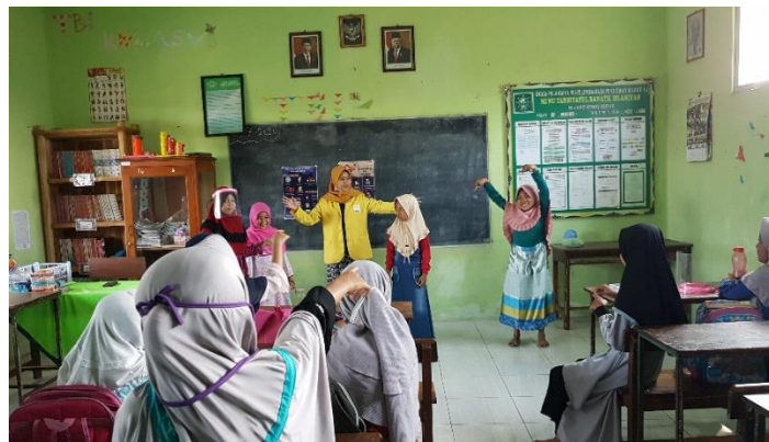
Gambar 4. Penyampaian Materi Social Distancing