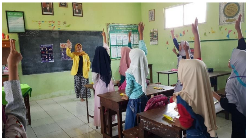
Gambar 7. Tahap Evaluasi

Melihat dari seluruh tahapan kegiatan pengabdian yang telah dilakukan, pelaksanaan kegiatan pengabdian ini terbilang berhasil karena semua siswa yang menjadi peserta penyuluhan mendapatkan makanan ringan. Bahkan ada beberapa dari mereka yang mendapat dua bungkus makanan ringan. Hal ini menandakan bahwa seluruh peserta penyuluhan memahami dengan baik materi PHBS yang telah disampaikan.