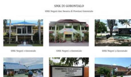
Gambar 3. Tampilan “SMK di Gorontalo”