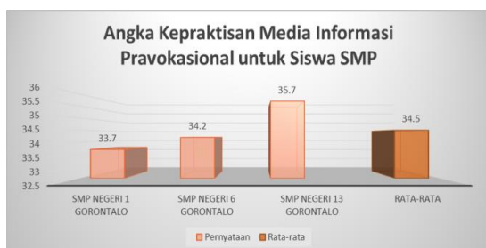
Gambar 3. Rata-rata Kepraktisan Media Informasi Pravokasional untuk Siswa SMP

Hasil akhir dari uji kepraktisan media informasi pravokasional menjelaskan bahwa siswa SMP yang berminat dalam mengetahui dan memahami SMK dan program studi SMK berada pada sekolah yang letak geografisnya berada jauh dari Kota Gorontalo dan belum mempunyai fasilitas internet yang memadai. Media informasi pravokasional ini sangat dibutuhkan oleh siswa-siswa SMP khususnya sekolah yang berada pada daerah yang belum semuanya terjangkau oleh internet. Hal ini bisa menjadi perhatian besar untuk pemerintah, bahwa pemerataan infrastruktur sekolah sangat dibutuhkan demi membangun generasi muda yang siap bersaing dalam dunia kerja.