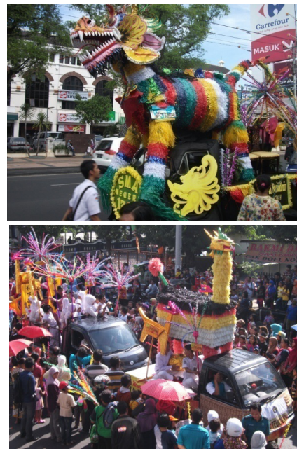
Gambar 1. Masyarakat tampak berjubel dan antusias untuk menyaksikan kirab Dugderan dengan maskot utama sebuah Warak Ngendog raksasa

ran ini Warak Ngendog dibuat dalam ukuran raksasa dan variatif. Warak Ngendog merupakan objek sentral ketika masyarakat sedang menyaksikan kirab budaya. Sebagai obyek yang paling dinanti-nanti, Warak Ngendog diciptakan dan dikreasikan menyatu dengan mobil hias. Masyarakat semakin termanjakan karena warak yang dihadirkan jumlahnya cukup banyak dan dibuat dengan kualitas yang baik. Bentuknya memiliki tingkat representasi yang realistik sampai sederhana bahkan kartunal.