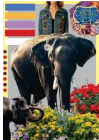
Gambar 2. Moodboard

Proses perancangan suatu desain dimulai dari pembuatan moodboard , penentuan tema yang akan disusun sebelum membuat rancangan busana yang akan di desain. Moodboard dilakukan dengan mencari sumber ide dari gambar-gambar berupa foto atau sketsa yang memuat suasana, warna dan tema hiasan dekoratif patchwork dengan motif bunga, garis, dan titik yang nantinya akan aplikasikan pada jaket wanita dengan teknik decorative trim. Berikut moodboard dari “EKSPLOKASI PATCHWORK MOTIF GAJAH SEBAGAI DECORATIVE TRIMS PADA JAKET WANITA”