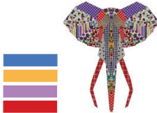
Gambar 4 Warna pada Patchwork

Pada dasarnya patchwork memiliki berbagai macam warna. Dalam proses menentukan skema warna pada moodboard sebagai pedoman untuk memperoleh susunan warna yang menarik.