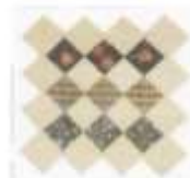
(f). machine piecing