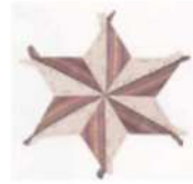
(d). tortoiseshell star