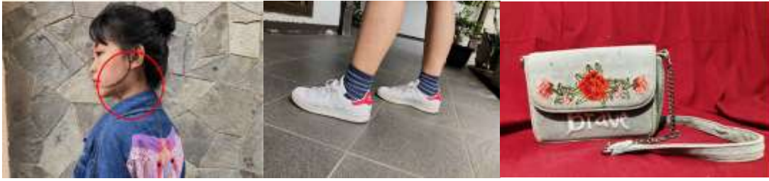
Gambar 5. Aksesoris dan Milineris