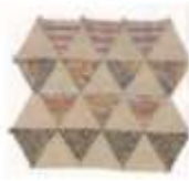
(g). machine piecing