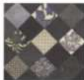
(e). compass star