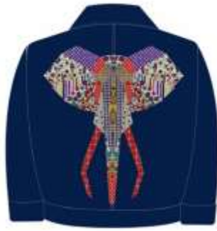
Gambar 1. Desain Produk