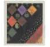
(h). combining machine