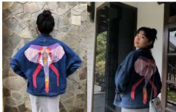
Gambar 4. Foto Produk