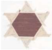
(c). hexagon star