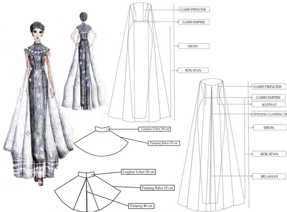
GAMBAR 2. Desain Busana Pesta Wanita

atau setelan jas, menerapkan detail seamless tucks pada bagian tertentu, menggunakan kain klasik untuk jas, dan warna gray scale. Hasil dari desain terpilih tampak pada GAMBAR 2 .