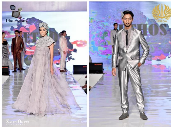
GAMBAR 4. Hasil Jadi Busana Pesta Wanita dan Pria

Busana pria terdiri dari setelan jas dan celana (suit), kemeja lengan panjang, dasi, dan hair piece. Desain jas pria berbentuk single breasted berkancing satu dan berkerah dengan peak lapel yang memiliki ujung runcing keatas, pada sambungan kerah menyerupai huruf ‘V’. Jenis kerah ini tergolong desain yang paling resmi atau formal. Penerapan seamless tucks pada kelepak kerah dan saku jas, memberi penekanan dan irama pada outfit busana formal pria. Penerapan warna gradasi abu-abu (gray scale) pada pria terlihat jelas pada penggunaan warna paling terang pada setelan jas, satu tingkatat lebih tua pada kemeja pria, dan warna dasi yang paling gelap. Baik pria dan wanita menggunakan aksesoris rambut berupa hair piece dan make-up warna silver dan abu-abu yang memberi kesan edgy (unik dan modern).