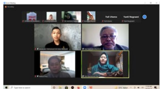
Gambar 2. Peserta pelatihan penulisan artikel ilmiah bagi guru-guru di Kabupaten Bora yang dilaksanakan secara daring dengan zoom meeting .

karena masih dalam masa pandemi Covid-19. Selain itu, disebabkan juga kesibukan para pengabdian; kegiatan ini dilaksanakan secara daring dengan zoom sehingga interaksi dan praktik menulis artikel ilmiah tidak bisa maksimal; masih banyak guru bidang studi Bahasa Indonesia di Kabupaten Bora yang belum pernah melakukan penelitian (Penelitian Tindakan Kelas), sehingga tidak ada bahan untuk membuat karya ilmiah hasil penelitian.