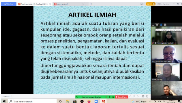
Gambar 1. Tim pengabdian sedang menyampaikan materi dalam kegiatan pengabdian kepada masyarakat bagi guru-guru di Kabupaten Bora

masih banyak yang belum paham penulisan karya ilmiah, baik artikel hasil penelitian maupun artikel konseptual. Hal ini bisa dimaklumi karena para guru belum pernah mendapat arahan dan pelatihan cara mengubah hasil penelitian menjadi sebuah artikel hasil penelitian yang siap dikirim ke jurnal tertentu. Dengan kegiatan ini, tentu ada pengetahuan baru tentang penulisan artikel ilmiah yang diperoleh oleh para guru di Kabupaten Bora.