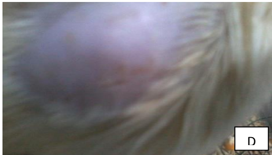
Gambar 7. Gambaran luka sayat tikus putih pada hari ke-7 pasca perlakuan.