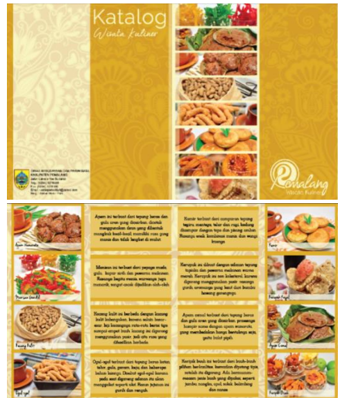
Judul : Katalog Wisata Kuliner Kabupaten Pemalang 1

Aplikasi fotografi makanan pada panduan wisata, dalam hal ini diaplikasikan ke dalam katalog.