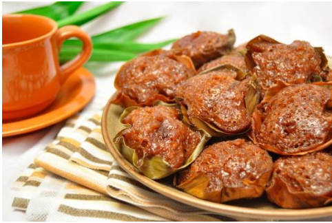
Judul : Apem Wanarata Exposure : f/4.8, 1/20 sec, ISO 200 Kamera : Nikon D5000 Skema pengambilan gambar: