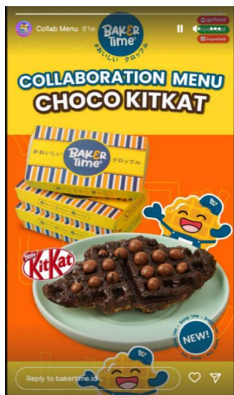
Gambar 3. Konten stories Baker Time