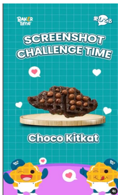
Gambar 4. Konten reels Baker Time

bagi para costumer , desain games adalah salah satu bentuk seni yang membawa dan mengimplementasikan kehidupan nyata ke dalam sebuah permainan dengan adanya desain konten games yang diiringi gerakan motion serta background music yang ceria akan membuat audiens memperhatikan atau mengikuti games tersebut. Bentuk konten instagram reels yang berbentuk sebuah game membuat para costumer menjadi lebih tertarik untuk memperhatikan desain reels yang dilihatnya dan juga dapat meningkatkan engagement brand hal ini juga berdasarkan dari hasil wawancara Bersama Informan 3 yang menyebutkan bahwa ia merasa tertarik dengan konten reels Baker Time yang berisikan tentang minigames yang digabungkan dengan product knowledge menurutnya itu sangat kreatif. Berikut ini merupakan bentuk konten dari penggunaan fitur reels yang digunakan brand Baker Time yang berdurasi 0.15 detik ini sebagai media promosi instagram.