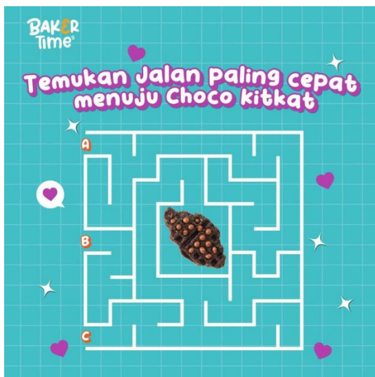
Gambar 2. Konten feeds Baker Time Berupa Games

interaktif dan games akan membuat audiens merasa lebih tertarik untuk dapat melihat serta memperhatikan desain promosi Baker Time , hal tersebut juga berdasarkan dari hasil wawancara bersama Informan 3 yang menyebutkan bahwa konten interaktif dan mini games disertai product knowledge sangat menarik baginya. Baker Time menggunakan beberapa desain games salah satunya seperti konten challenge . Berikut merupakan contoh konten challenge yang di buat oleh brand Baker Time .