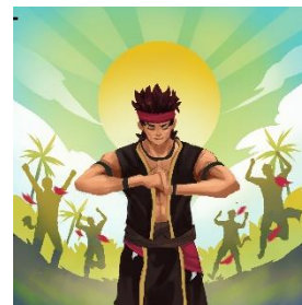
Gambar 4. Ilustrasi halaman 28 & 29