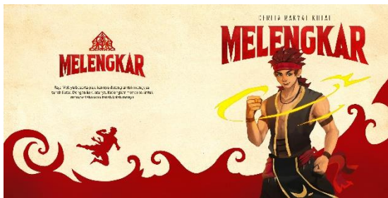
Gambar 1. Sampul depan dan belakang

Judul : Cover Buku Ukuran : 40x20 cm (1 ilustrasi) Media : Digital print Tahun : 2023