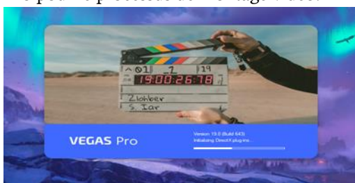
Vue initiale du logiciel

Après que les chercheurs aient mené une analyse des besoins des élèves de l'YSKI Christian High School Semarang, un plan de recherche a été formé qui deviendrait une référence pour les chercheurs pour la fabrication et le développement de produits. Le produit qui sera créé est un média d'apprentissage en podcast basé sur YouTube pour les compétences d'écoute en français des élèves de la classe X. Dans la première étape de développement du produit, le chercheur réalise un script pour le matériel du présentateur en se référant au dernier programme du lycée français pour la classe X. Les chercheurs ont pris du KD 3.2 avec le thème en tant que présentateur pour créer plus tard un produit de podcast. Ce script est fait en un seul KD car lors de l'apprentissage, l'enseignant inclut toujours un KD dans son RPP à chaque fois qu'il enseigne. Ensuite, à l'étape suivante, le podcast vidéo est tourné devant la bibliothèque de la Maison des sciences le dimanche 19 juin 2022 à 10h00-11h00 WIB. Et la prochaine étape est le processus de montage vidéo du podcast. A ce stade, le chercheur utilise le logiciel Magix Vegas Pro pour le processus de montage vidéo.