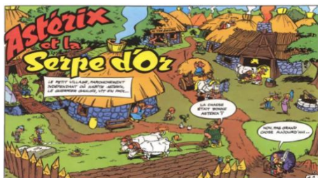
Figure 6. élément culturel dans Astérix Le petit village, farouchement indépendant où habite Astérix, le guerrier Gaulois, vi t'en paix...

Sur la figure 6, la Gaule est le seul village qui n'a pas été conquis par Jules César et les Romains. Le village est entouré de plages et le reste est une forêt qui était fortement gardée par quatre garnisons romaines qui espionnaient toujours le village. Les gens connaissent les techniques d'agriculture et d'élevage (moyens de subsistance).