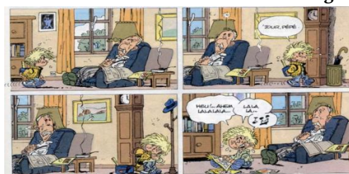
Figure 1. élément culturel dans Cédric 1

Sur la figure 1, nous pouvons voir que le grand-père de Cédric s'est endormi en lisant le journal. La culture de la lecture des journaux est une habitude portée par les Français. La culture de la lecture des journaux est généralement pratiquée par des personnes âgées. Cette culture de la lecture de journaux est encore pratiquée aujourd'hui.