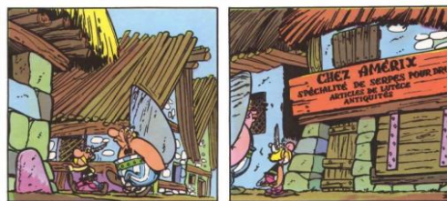
Figure 8. élément culturel dans Astérix

Sur la figure 8, les habitants de Lutèce vivent dans la plaine fluviale, élèvent des animaux et pratiquent l'agriculture. Ils s'installèrent dans des villages, dans des maisons de bois et d'argile faciles à démonter et à déplacer si besoin. Ils sont aussi souvent nomades ou nomades.