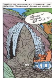
Figure 5. élément culturel dans Astérix

“Obelix, le tailleur et livreur de menhirs, travaille dans la joie...”