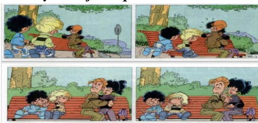
Figure 2. élément culturel dans Cédric 1

Sur la figure 2, embrasser dans les lieux publics est quelque chose qui est habituellement fait par les Français. Cependant, si cela est fait en Indonésie, cela est considéré comme une violation des normes morales. Cet indicateur est inclus dans les types d'éléments culturels du système juridique et des normes.