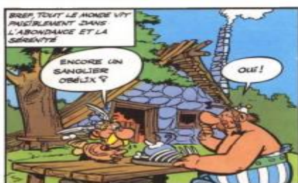
Figure 7. élément culturel dans Astérix