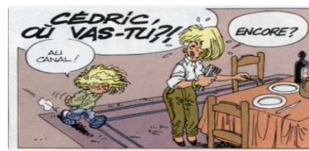
Figure 3. élément culturel dans Cédric 1

Selon la source https://francis09upi.wordpress.com , les Français utilisent généralement des assiettes, des couteaux