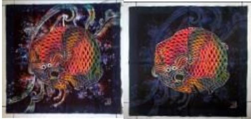
Hasil pematikan 1x proses dan 2x

menemukannya kepuasan pada bagian background lukisan. Selain itu untuk mengubah kontur garis putih sebagai struktur pembentuk subjeck utama lukisan menjadi titik-titik putih yang berderet.