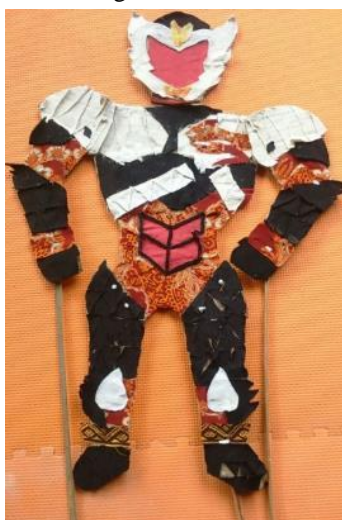
Gambar 39. Karya Wayang Karton Kriteria Sangat Baik

Hasil Karya Wayang Karton Superhero Kategori Sangat Baik