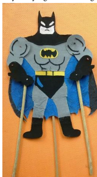
Gambar 39. Karya Wayang Karton Kriteria Baik.