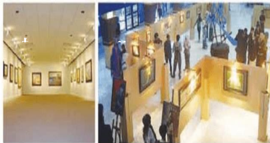
Gambar 4. Ilustrasi Pameran

Foto pada Materi Bab X Semester 2 tentang Pameran adalah sebagai berikut.