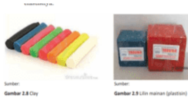
Gambar 2. Materi alat dan bahan seni patung

Materi alat dan bahan seni patung dibagi menjadi materi bahan dan alat. Pada materi bahan dikelompokkan menjadi empat, yaitu: bahan lunak, bahan sedang, bahan keras, dan bahan cor/cetak. Pada keempat materi tersebut, ilustrasi untuk penjelasannya hanya terdapat pada bahan lunak. Kurang detail contoh ilustrasi pada materi bahan yang ditampilkan sehingga menyulitkan pembaca dalam mengamati ilustrasi tersebut. Sedangkan pada materi alat diterangkan tujuh jenis alat yang digunakan untuk membuat patung. Contoh ilustrasi yang ditampilkan hanya dua gambar yaitu foto ( image ) butsir dan meja putar.