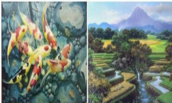
Gambar 1. Lukisan Gaya Naturalisme Koleksi Karya Indra Rukmana

Foto lukisan pada pengertian lukisan dan gaya lukisan