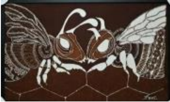
Gambar 6. Tali Jiwa 2, kain primis, 50 cm x 80 cm, 2019