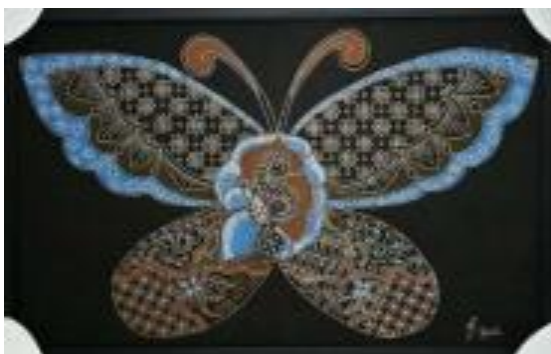
Gambar 8. Metamorfosis, kain primis, 50 cm x 80 cm, 2019