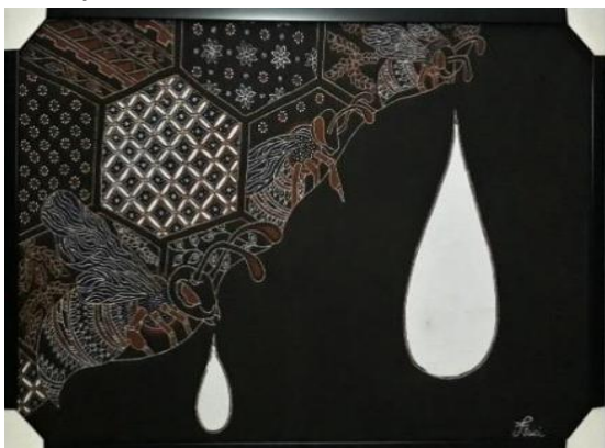
Gambar 9. Pemburu Madu, kain primis, 50 cm x 80 cm, 2019