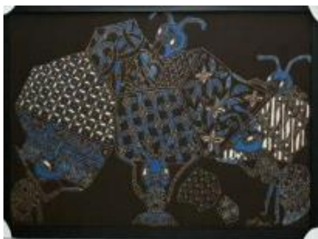
Gambar 3. Berbagi 1, kain primis, 50 cm x 80 cm, 2019