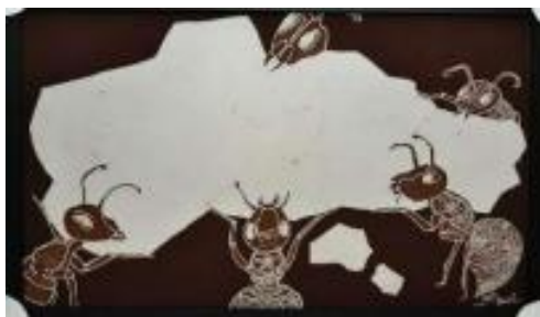
Gambar 4. Berbagi 2, kain primis, 50 cm x 80 cm, 2019