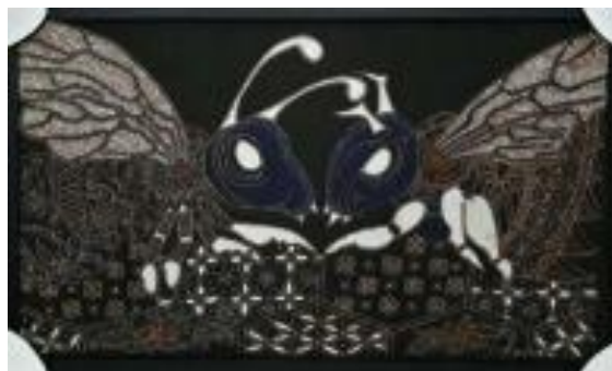
Gambar 5. Tali Jiwa 1, kain primis, 50 cm x 80 cm, 2019