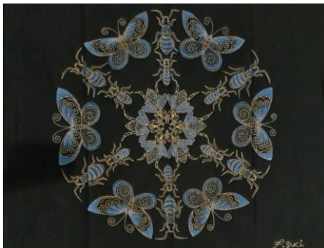
Gambar 1. Bersatu dalam Perbedaan, kain primis, 100 cm x 110 cm, 2019