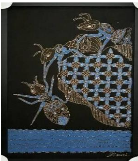
Gambar 13. Tolong-Menolong, kain premis, 50 cm x 80 cm, 2019