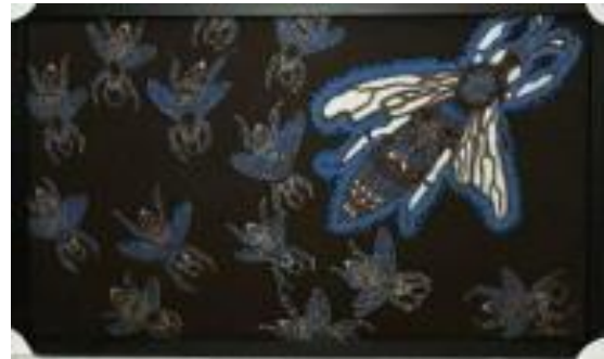
Gambar 7. Koloni, kain primis, 50 cm x 80 cm, 2019