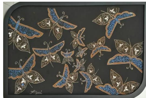
Gambar 11. Jejak Tandus, kain primis, 50cm x 80 cm, 2019