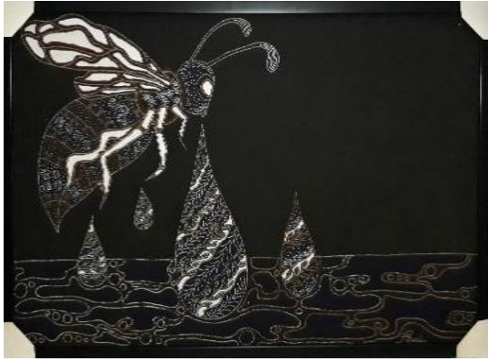
Gambar 10. Raja Madu, kain primis, 50 cm x 80 cm, 2019