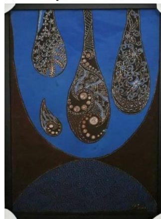
Gambar 14. Tetesan Madu, kain premis, 50 cm x 80 cm, 2019