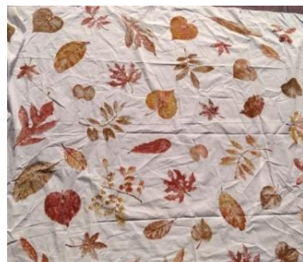
Gambar 6. Penjemuran pertama

Setelah penempelan daun dilakukan pada seluruh permukaan kain, proses selanjutnya adalah penjemuran. Penjemuran dilakukan setelah permukaan kain telah terisi motif gesek godhong secara penuh. Kain dijemur di bawah sinar matahari langsung untuk memunculkan warna aslinya. Penjemuran dilakukan selama kurang lebih satu jam.