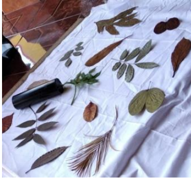
Gambar 3. Proses pemolaan tekstil gesek godhong

seratnya menonjol untuk menghasilkan motif khas serat daun. Daun-daun ditempel dengan memperhatikan keseimbangan untuk menghasilkan pola motif yang harmoni, dinamis, dan utuh dalam satu kesatuan.