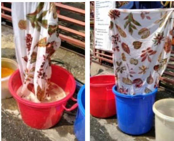
Gambar 8. Proses pembilasan

Kemudian kain langsung dimasukkan ke dalam ember yang telah berisi air dan deterjen. Kain dengan cara dikucek perlahan hingga bersih dari sisa larutan HCl dan garam nitrit. Selanjutnya kain dibilas dengan air bersih sebanyak dua kali bilasan.