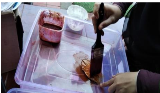
Gambar 4. Proses pewarnaan

Setelah kain dibentuk pola yang telah ditentukan, selanjutnya daun yang ditempelkan diangkat terlebih dahulu untuk diberi warna pada bagian luar atau yang seratnya menonjol satu-persatu. Sapukan warna naphthol yang telah disiapkan pada daun dengan menggunakan kuas besar. Komposisi warna yang disapukan pada daun adalah 80% warna dasar (kuning, hijau, dan merah) dan 20% warna kombinasi. Warna kombinasi diambil dari salah satu warna yang digunakan tersebut. Warna kombinasi tidak disapukan, melainkan diteteskan menggunakan kuas kecil pada bagian-bagian tertentu daun yang membutuhkan estetika gradasi warna. Daun yang telah diberi warna dipercikkan perlahan supaya warnanya tidak terlalu menutupi seluruh serat daun. Letakkan daun pada kain sesuai pola yang telah dibentuk sebelumnya.