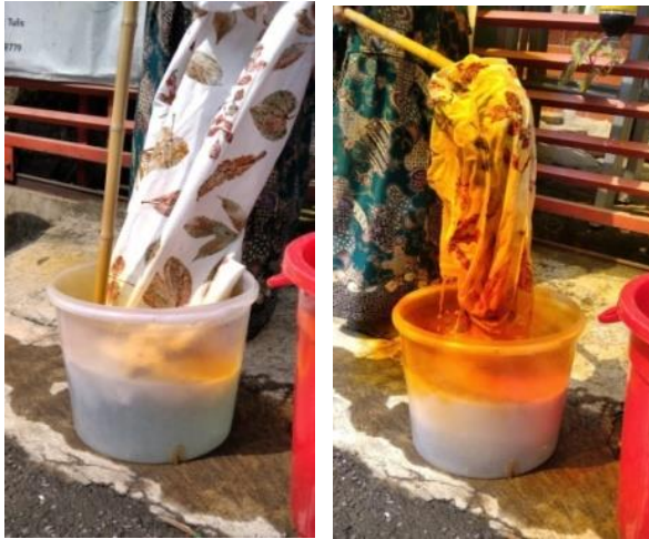
Gambar 7. Proses Fiksasi

Setelah warna motif telah benar-benar tampak secara sempurna, kain difiksasi menggunakan larutan HCl 200 ml yang telah dicampur air bersih 11 liter dan ditambahkan 250 gr garam nitrit. Proses fiksasi dilakukan beberapa menit setelah kedua larutan tersebut menghasilkan reaksi kimia. Kain dicelupkan sambil sesekali diangkat dan dicelupkan kembali hingga beberapa kali dengan alat stik kayu atau bambu.