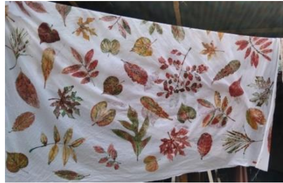
Gambar 9. Proses penjemuran kedua

Jika telah dibilas bersih dijemur dengan cara diangin-anginkan atau tidak terkena cahaya matahari secara langsung. Penejemuran kedua berfungsi untuk memunculkan warna motif gesek godhong setelah fiksasi, yaitu warna yang lebih pudar atau soft.