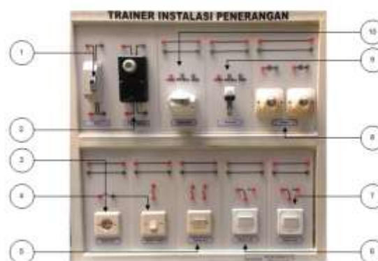
Gambar 3. Trainer instalasi penerangan

Produk yang dihasilkan berupa trainer instalasi penerangan rumah tinggal untuk mata pelajaran instalasi listrik. Bentuk dan bagian-bagian trainer instalasi penerangan ini bisa dilihat pada gambar berikut :